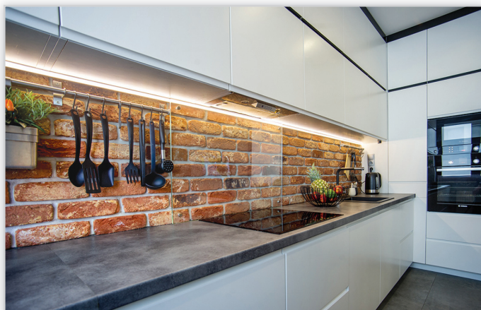
Cegły i płytki ręcznie formowane – 60 Oud Brabant

Zastosowanie: elewacje wszelkiego rodzaju budynków, elementy dekoracyjne we wnętrzach, ogrodzenia i mała architektura.