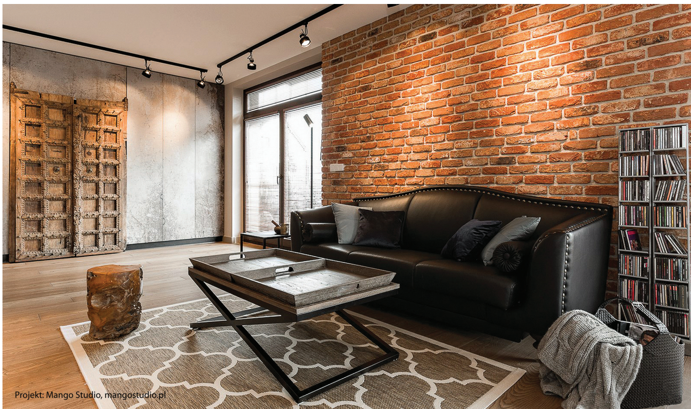
Projekt: Mango Studio, mangostudio.pl