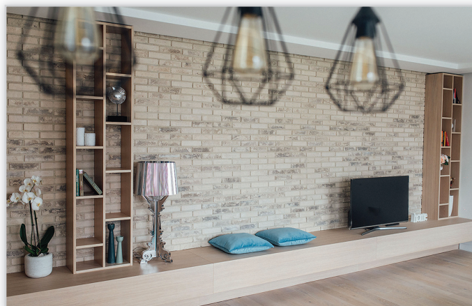
Cegły i płytki ręcznie formowane – 124 Lima

Projekt: Dalmiko Design, ww.dalmiko.pl . Zastosowanie: elewacje wszelkiego rodzaju budynków, elementy dekoracyjne we wnętrzach, ogrodzenia i mała architektura.