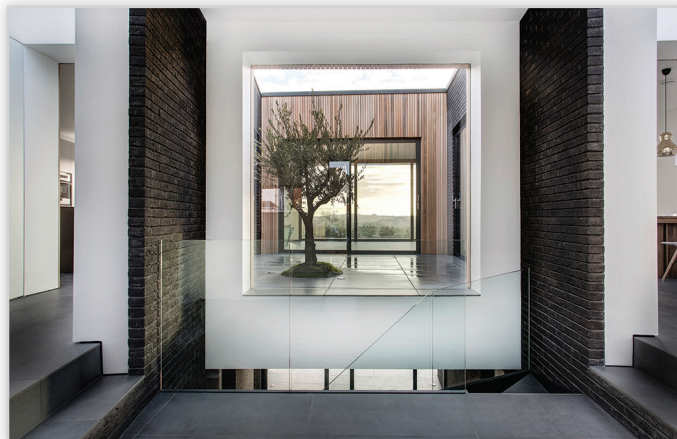
Cegły i płytki ręcznie formowane – 533 Morvan

Zastosowanie: elewacje wszelkiego rodzaju budynków, elementy dekoracyjne we wnętrzach, ogrodzenia i mała architektura.