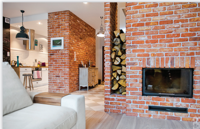
Cegły i płytki ręcznie formowane – 40 oud Maasland

Zastosowanie: elewacje wszelkiego rodzaju budynków, elementy dekoracyjne we wnętrzach, ogrodzenia i mała architektura.